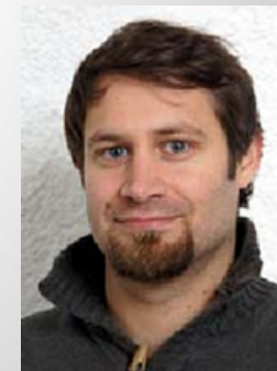
Corvin Mayer Ethik