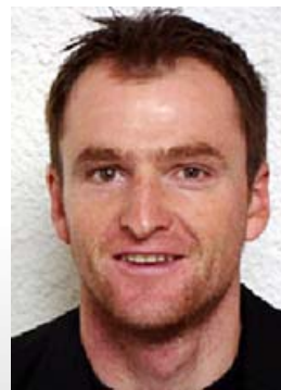
Roman Richthammer Sport